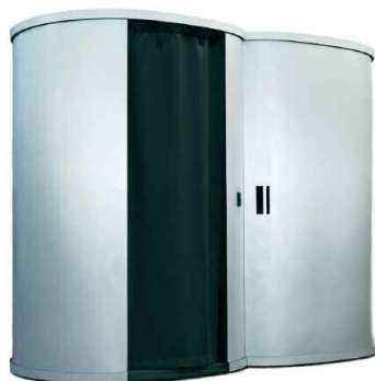
La photomobile® 3 places finition métal Dimensions : 1m80 de hauteur, 1m20 cm de largeur, 2m30 de longueur.