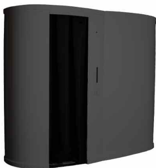
La photomobile® 2 places finition noire ardoise Dimensions : 1m60 de hauteur, 85 cm de largeur, 2m16 de longueur.